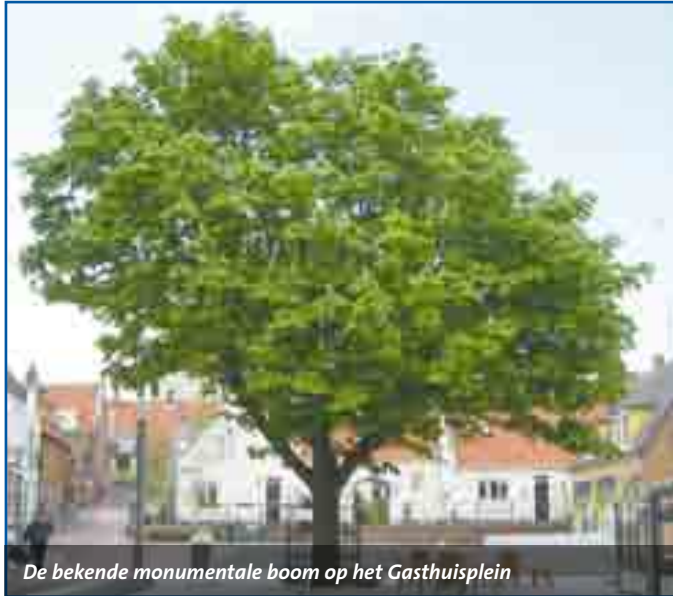
De bekende monumentale boom op het Gasthuisplein

De gezamenlijke historische verenigingen, vertegenwoordigd in de Stichting Behoud Zandvoorts Cultureel Erfgoed (BZCE), organiseren op zaterdag 8 en zondag 9 september de Open Monumentendagen. Het landelijke thema is 'Groen van Toen'.